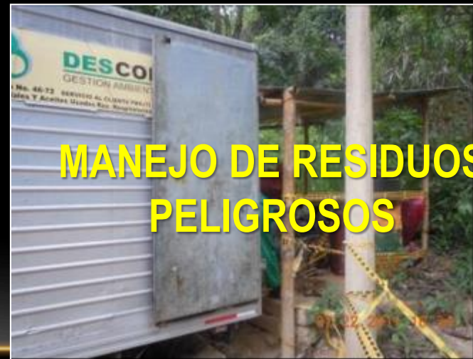
MANEJO DE RESIDUOS PELIGROSOS