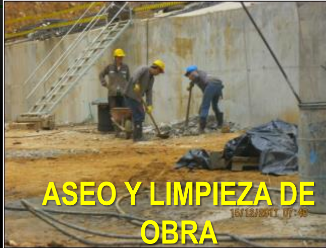
ASEO Y LIMPIEZA DE OBRA