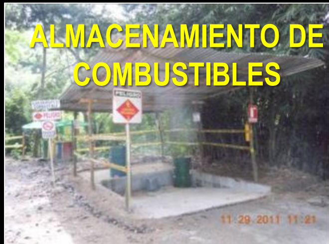
ALMACENAMIENTO DE COMBUSTIBLES