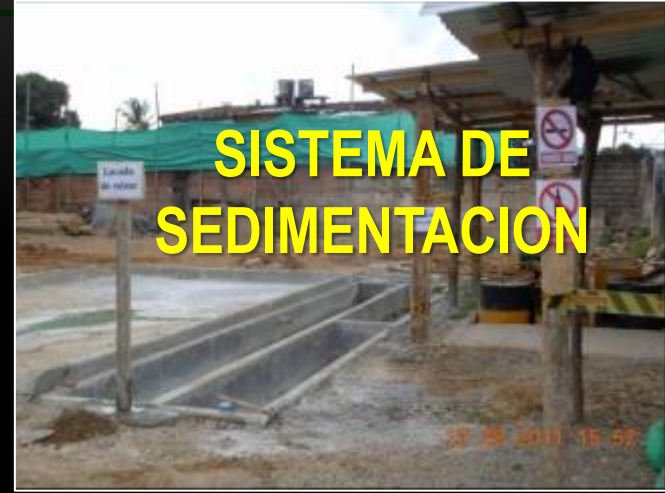
SISTEMA DE SEDIMENTACION